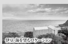
伊豆 海を望むロケーション