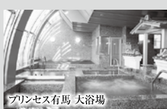
プリンセス有馬 大浴場