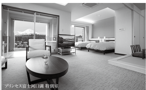
プリンセス富士河口湖 特別室

※京都熱海へご宿泊の際は、宿泊税が導入されております。 ※温泉導入ホテルは別途、入湯税150円が必要です。