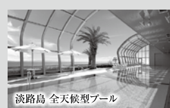
淡路島 全天候型プール