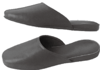
スタンダードタイプ