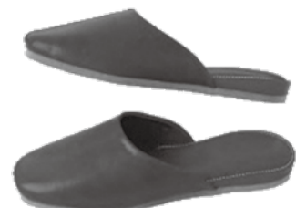
天然ゴム入りスポンジ底タイプ