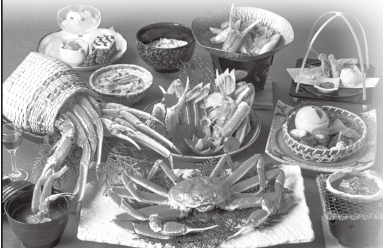
冬の会席料理一例

旬を愛でる会席料理は、当クラブの自慢です。 大勢の組合員さまにご利用いただいております。